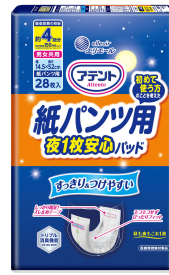
『アテント 紙パンツ用夜 1枚安心パッド 4回吸収／6回吸収』