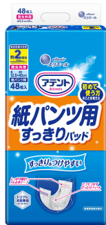
『アテント 紙パンツ用すっきりパッド 2回吸収』

衛生用紙製品 No.1 ブランド ※1 の「エリエール」を展開する大王製紙株式会社（本社：東京都千代田区）は、「アテント 紙パンツ用さらさらパッド 通気性プラス」のモレやつけやすさを改良した『アテント 紙パンツ用すっきりパッド 2回吸収』、『アテント 紙パンツ用夜 1枚安心パッド 4回吸収／6回吸収』を2024年5月21日（火）から全国発売します。