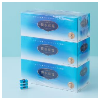
「エリエール 贅沢保湿ティッシュ」 実商品との比較